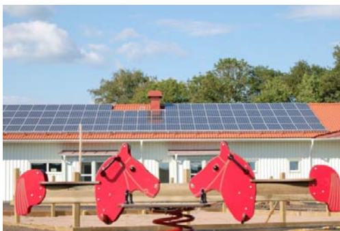
Prästgårdsängens förskola i Fjärås