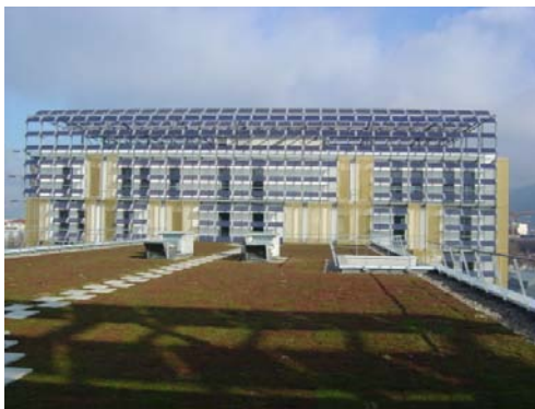
Fransk byggnad med solceller.

Samtliga rapporter från Task 10-arbetet har ännu inte avslutats. På projektets hemsida; http://www.iea-pvps-task10.org kan fem rapporter laddas ner i form av pdf:er. Huvudrapporten från arbetet är en bok som nu finns utgiven av förlaget Earthscan i England ( http://www.earthscan.co.uk/?tabid=74758 ). Boken har titeln "PV in the Urban Environment" och innehåller bla ett flertal case-studies där storskaliga BIPV-satsningar beskrivs i detalj. Sverige har bidraget med en presentation av anläggningarna i Malmö. Det viktigaste bidraget från Sverige är annars arbetet med att utveckla projekteringshjälpmedlet bipvtool.com, en internationell version av solcell.nu.