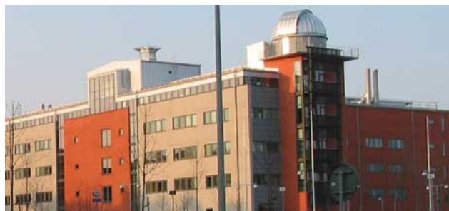
Ångströmlaboratoriet i Uppsala

Efter seminariet finns möjlighet att besöka Solibros forskningsenhet i Uppsala eller träffa de världsledande forskare som arbetar med att utveckla framtidens tunnfilmssolceller på Ångströmlaboratoriet.