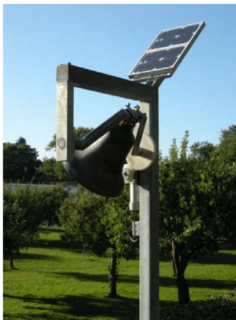
The Ecchoing Green.

placering på Rosendals trädgårdar. Under hösten kommer en artikel om utställningen att publiceras i en konsttidskrift.