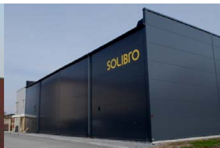
Solibro Research AB i Uppsala